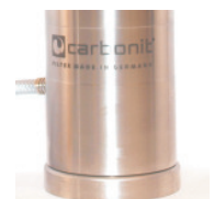
SANUNO inoxF mit Fuß

Weitere Informationen, Gutachten, Zertifikate und aktuelle Entwicklungen finden Sie im Internet unter www.carbonit.com / Mein Filter.